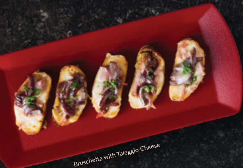
Bruschetta with Taleggio Cheese