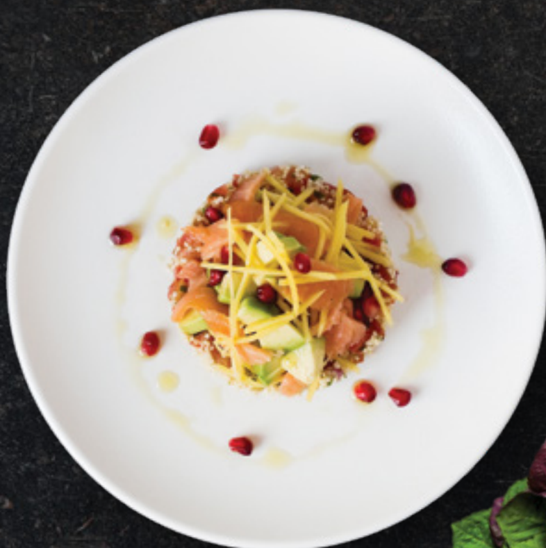
Quinoa with Smoked Salmon

Τηγανιτές πατάτες με πικάντικη σάλτσα, πέστο λιαστής ντομάτας. Τελειωμένο με σάλτσα από μαγιονέζα & λεμόνι