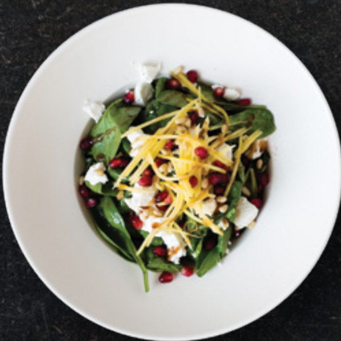
Spinach & Goat's Cheese Salad

Κινέζικο μαρούλι με ποσέ φιλέτο σολομού, σελινόριζα και κάπαρι. Σερβίρεται με σάλτσα Μαρζάνο