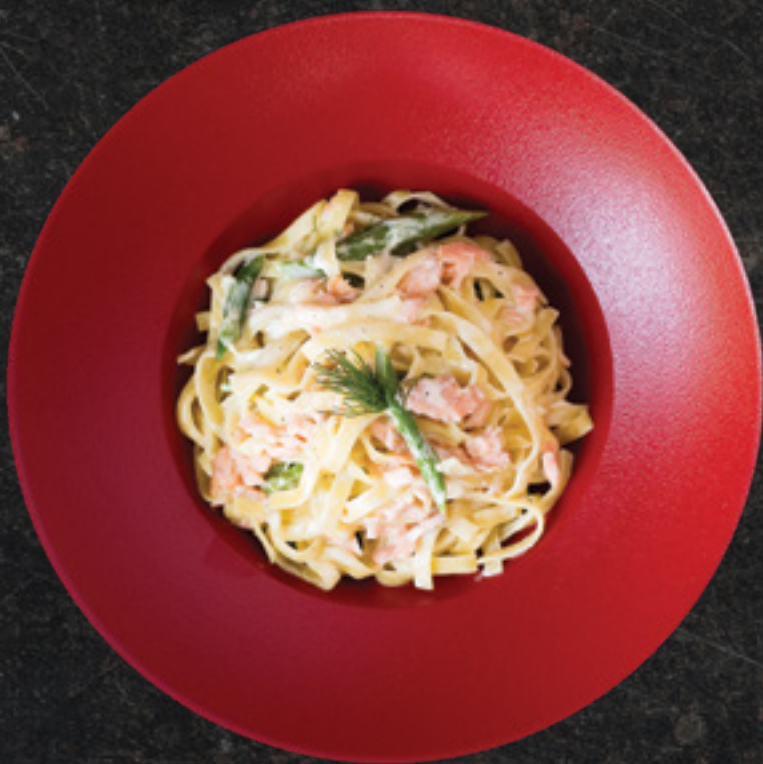
Tagliatelle Al Salmone E Asparagi