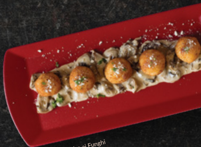
Arancini con Salsa ai Funghi