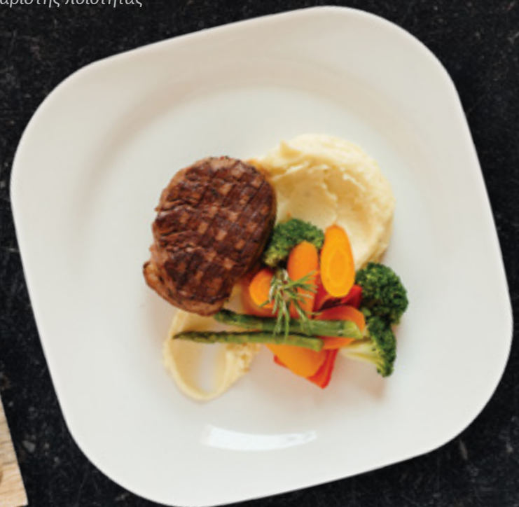
Bistecca Di Manzo

Πάντοτε χρησιμοποιούμε φρέσκα και κατεψυγμένα κρέατα αρίστης ποιότητας