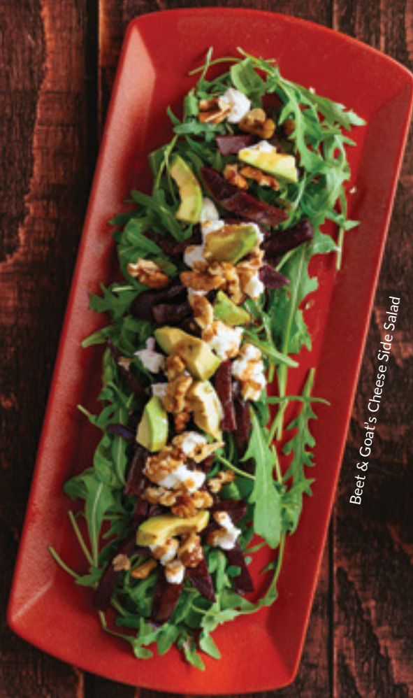
Beet & Goat's Cheese Side Salad