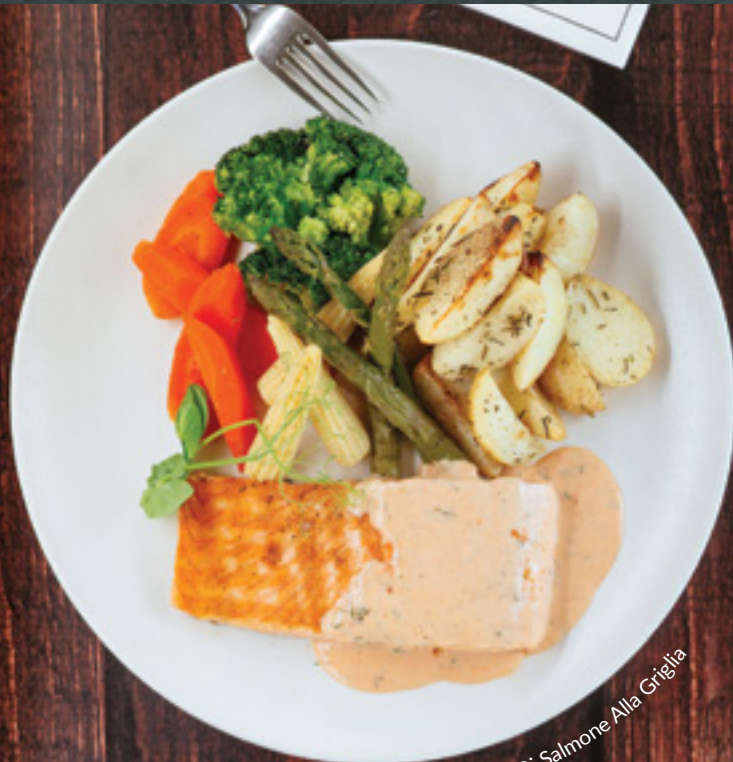
Filetto Di Salmone Alla Griglia