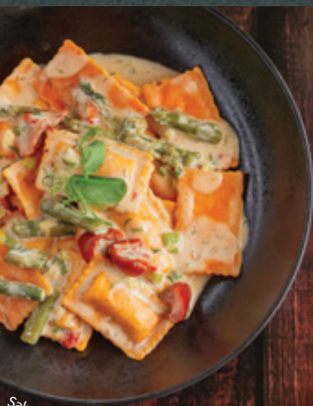
Salmon Ravioli with Vodka