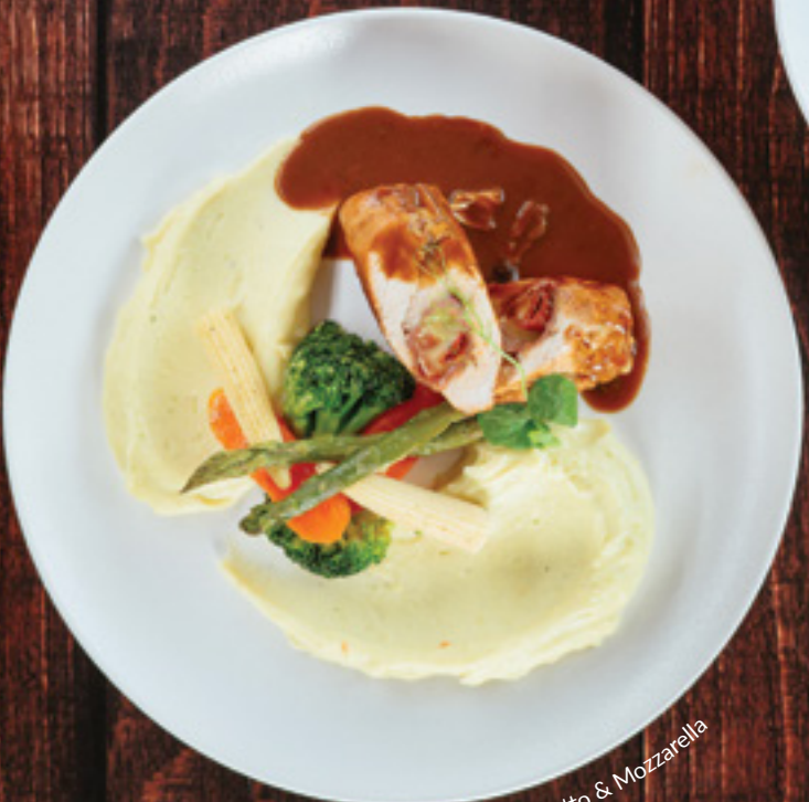
Pollo Stuffed with Prosciutto & Mozzarella