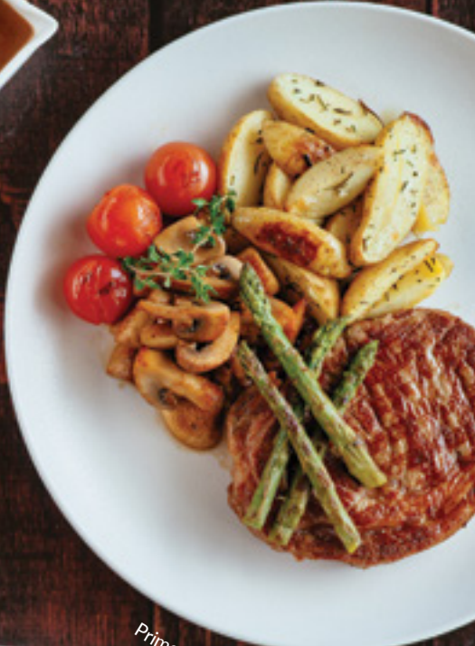
Prime Rib Eye