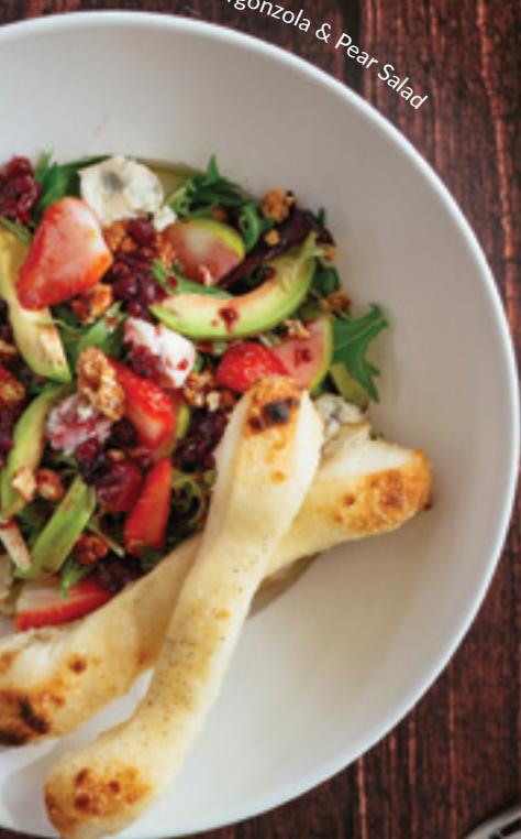
Gorgonzola & Pear Salad