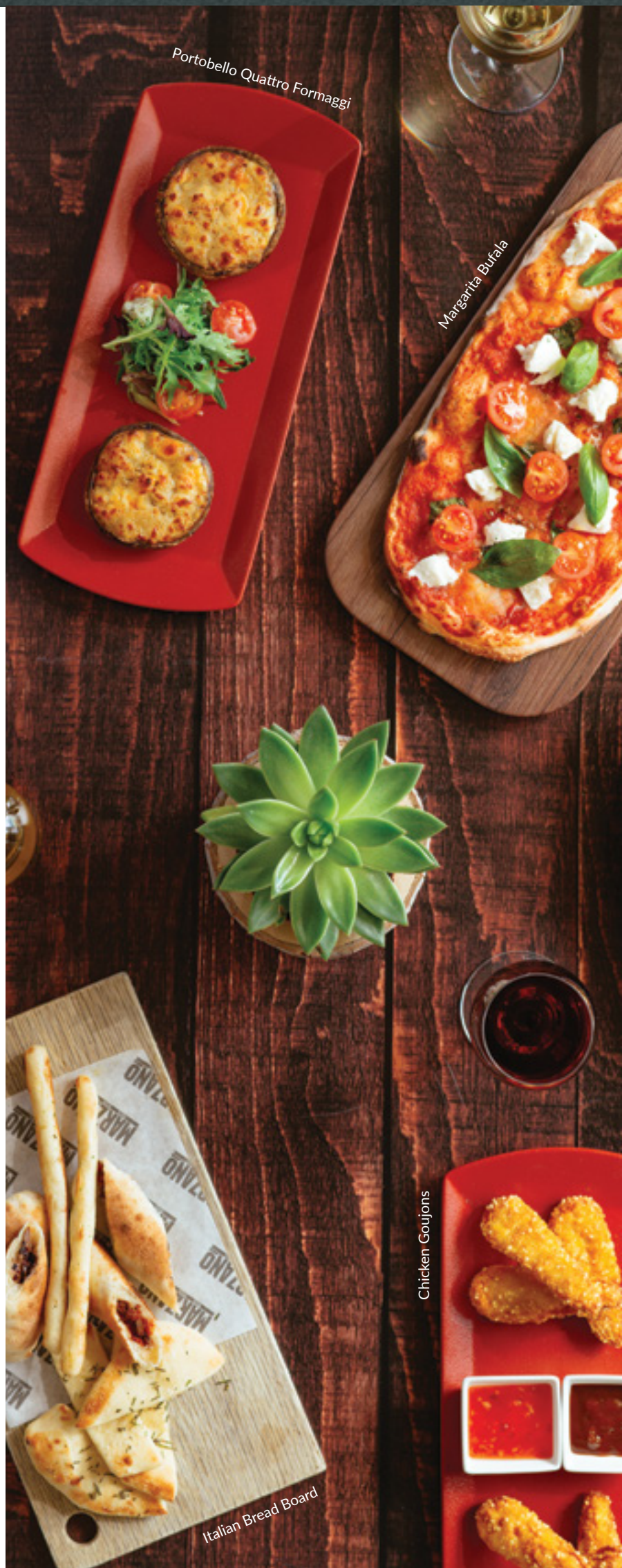
Portobello Quattro Formaggi

Οι τιμές περιλαμβάνουν όλες τις νόμιμες χρεώσεις