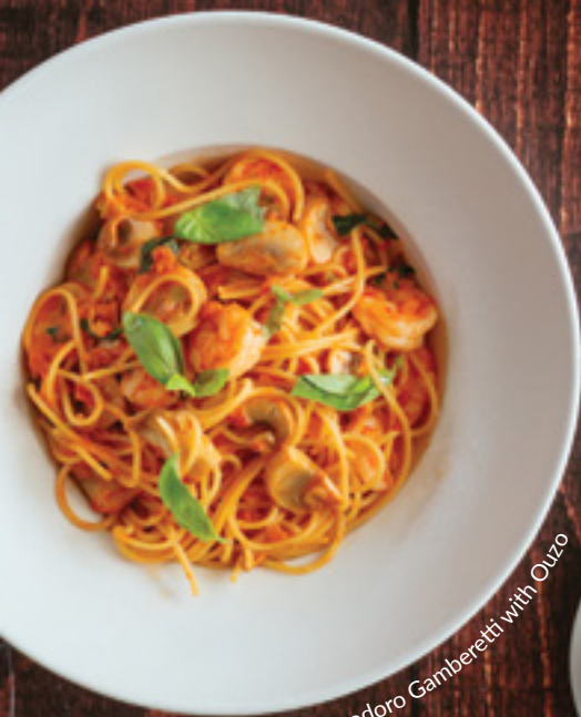
Pomodoro Gamberetti with Olivo