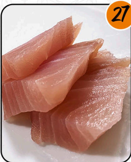
MEDREGAL ALÉRGENOS: PESCADO