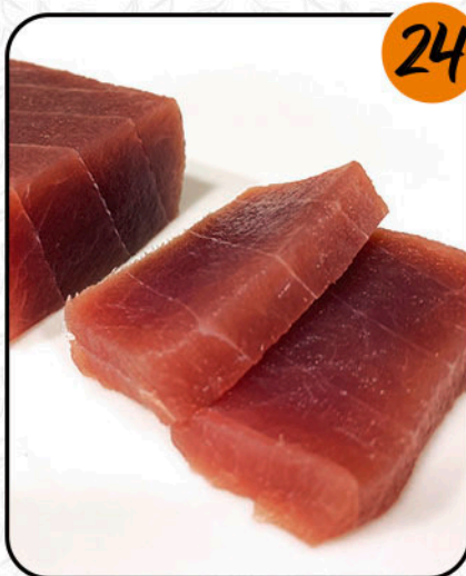
ATÚN ALÉRGENOS: PESCADO