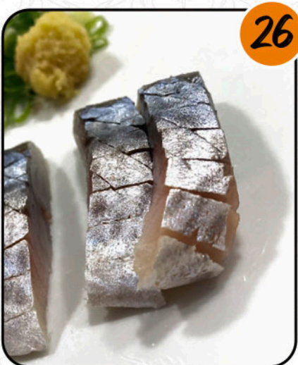
CABALLA ALÉRGENOS: PESCADO