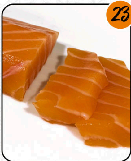
SALMÓN ALÉRGENOS: PESCADO