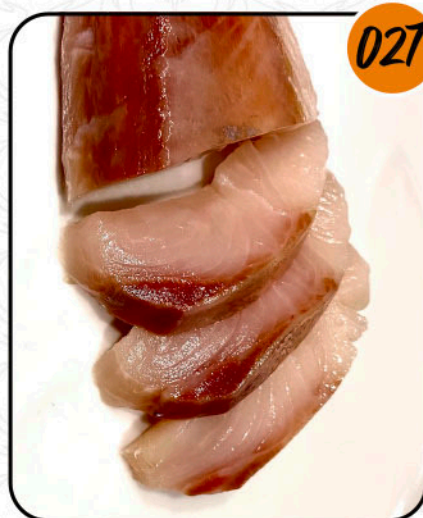
HAMACHI (PESCADO JAPONÉS) ALÉRGENOS: PESCADO